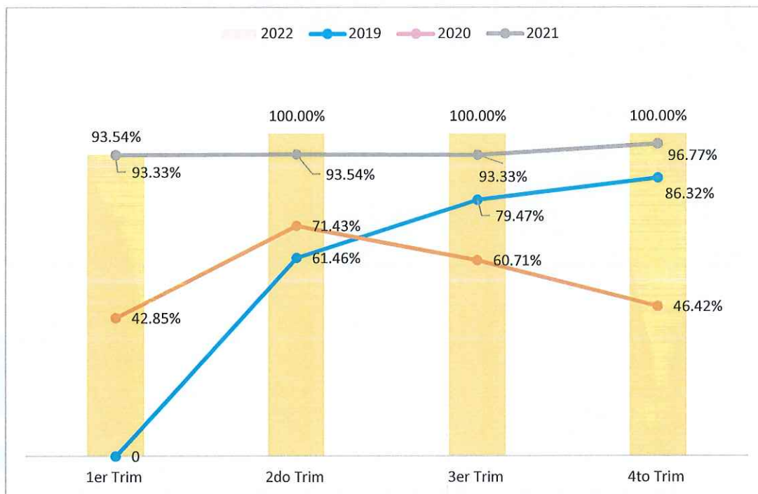
Gráfica 3 Entrega de Programas Presupuestarios por ejercicio fiscal 2019-2022

Fuente: Elaboración propia con datos de los reportes trimestrales emitidos ante la Secretaría de Planeación y Evaluación en el periodo 2019-2022