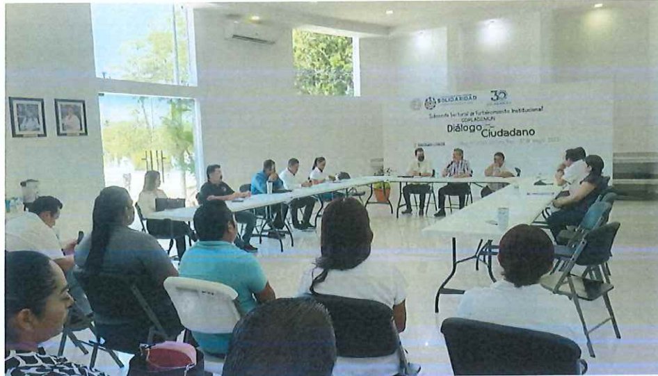
Imagen 2.-Diálogo ciudadano del Subcomité Sectorial de Fortalecimiento Institucional.

2023, Año del 30 aniversario de la creación del Municipio de Solidaridad