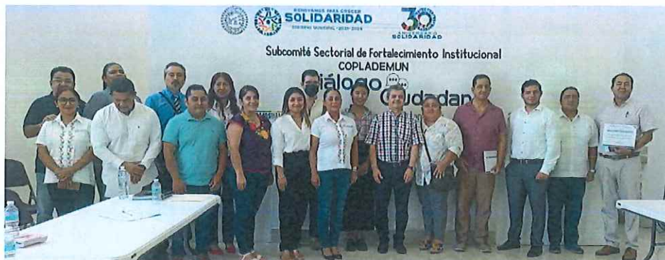
Imagen 1.-Diálogo ciudadano; Subcomité Sectorial de Fortalecimiento Institucional, COPLADEMUN Solidaridad.

El Bando de Gobierno para el Municipio Solidaridad contempla como fin del Ayuntamiento la promoción y organización de la participación ciudadana para cumplir con los planes y programas; para lo cual debe establecer diversas formas de participación y colaboración ciudadana como lo son el Consejo Consultivo Ciudadano; los Comités de Participación Ciudadana; los Comités de Vecinos; y las Consultas Públicas. En particular, el Bando de Gobierno contempla el apoyo ciudadano en seguridad pública; protección civil; protección al medio ambiente; desarrollo social; y la planeación. De igual modo, en el mes de mayo el Subcomité de Fortalecimiento Institucional de COPLADEMUN realiza el primer Diálogo Ciudadano, donde se reunieron funcionarios públicos de la administración pública municipal de Solidaridad y la ciudadanía, para conocer y escuchar las problemáticas y dar posibles soluciones a la gestión pública.