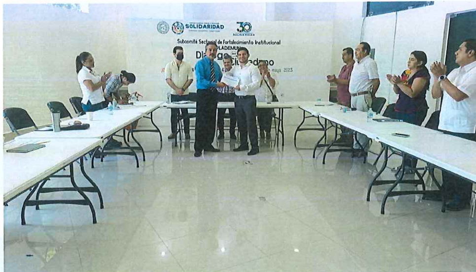
Imagen 3.- "Diálogo Ciudadano" en reconocimiento de su participación y colaboración a los participantes como ponentes.

Se anexa minuta de trabajo de los pormenores y detalles del mecanismo de cocreación y participación ciudadana para la planeación municipal.