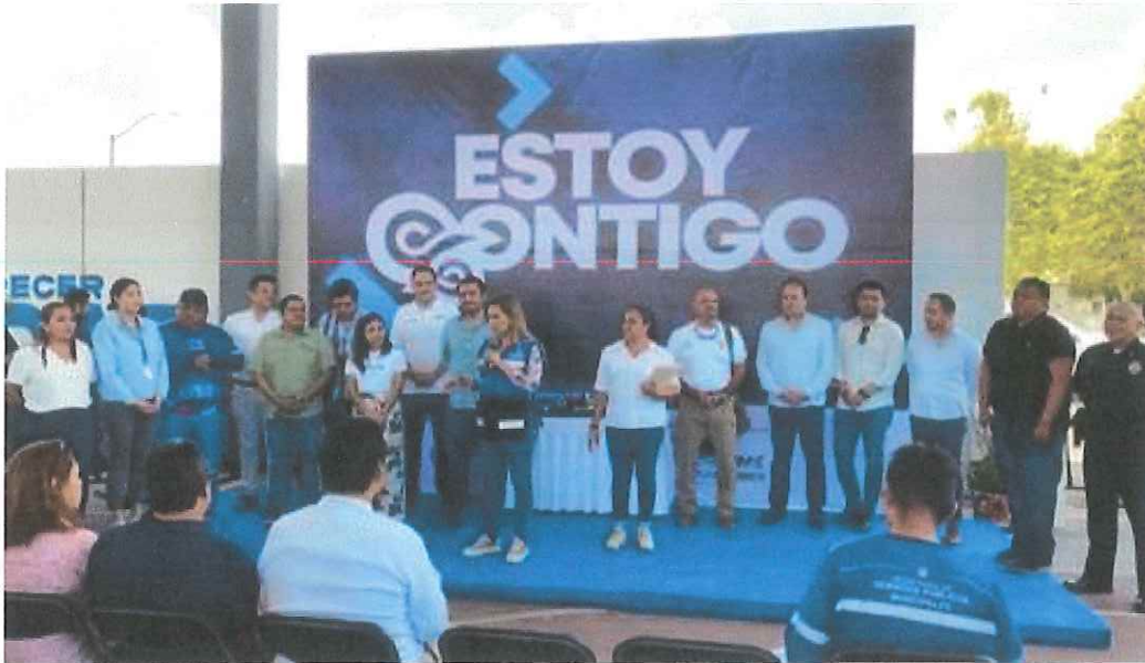
Imagen 1. Programa Estoy Contigo