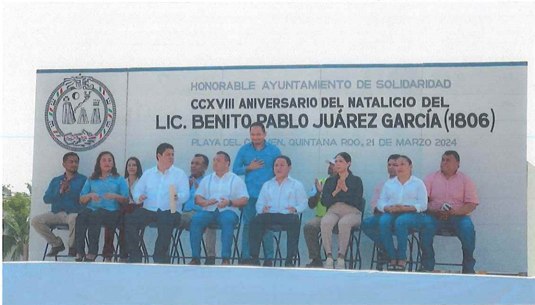
Imagen 3. Acto Cívico

“2024, año del 50 aniversario del Estado Libre y Soberano de Quintana Roo”