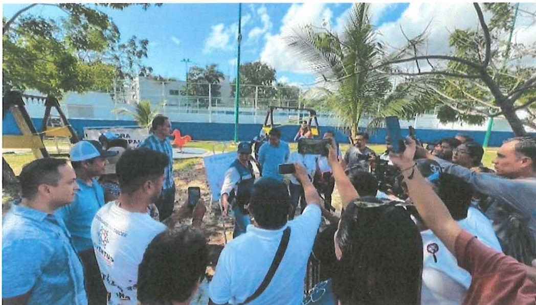
Imagen 2. Recorrido de Obra Pública