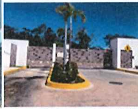
Imagen 3. Acceso a las viviendas