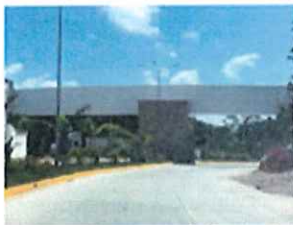
Imagen 1 y 2. Caseta de acceso al fraccionamiento.