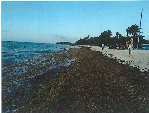
Tabla 2. Histórico de recolección de sargazo 2023.