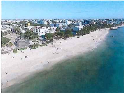
Figura 1. De Av. Juárez hacia Calle 4, vista norte.