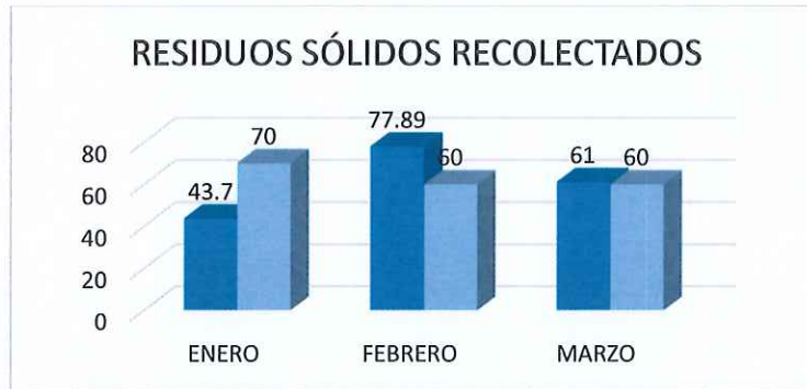
Gráfica 2: Recolección de residuos sólidos del primer trimestre de 2022 de la ZOFEMAT.

Durante el primer trimestre del presente año 2022, se recolectaron 182.59 toneladas de residuos sólidos. Durante el mes de enero se recolectó la cantidad de 43.70 toneladas de residuos sólidos, una cantidad baja a lo programado para ese mes, durante el mes de febrero se recolectó la cantidad de 77.89 toneladas de residuos sólidos, siendo una cantidad mayor a lo programado, para el mes de marzo se recolectó 61.00 toneladas de residuos sólidos. Residuo sólido recolectado en las playas públicas y playas certificadas del Municipio de Solidaridad.