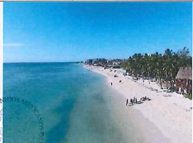
Figura 5. De Calle 40 hacia el muelle fiscal, vista