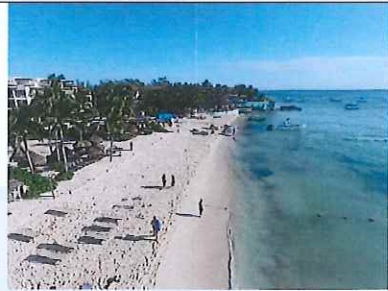
Figura 6. De Calle 40 hacia El diablito, vista norte.