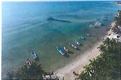
Figura 3. Calle 16, vista suroeste.