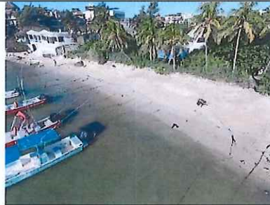
Figura 4. De Calle 16, vista sur.