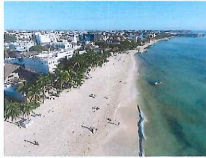
Figura 2. De Av. Juárez hacia Calle 4, vista norte.