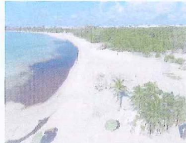
Figura 5. Punta Esmeralda (cenote y mar)