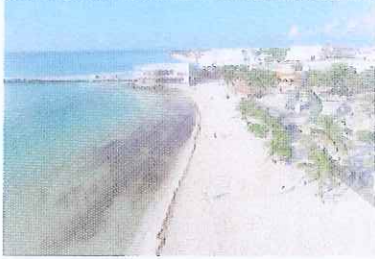
Figura 12. Vista norte Playa Caribe.