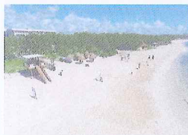
Figura 9. Playa 88.