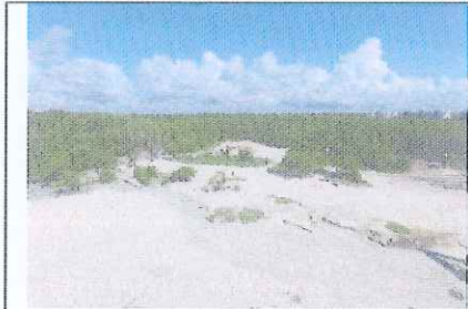
Figura 6. Punta Esmeralda, vista Cenote.