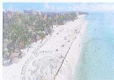
Figura 19. Vista norte de la Calle 38 a Calle 40.