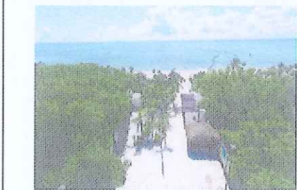
Figura 8. Playa 88, acceso.