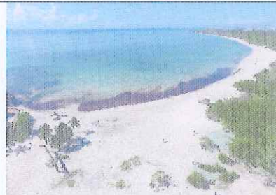
Figura 7. Vista norte de Punta Esmerald a.