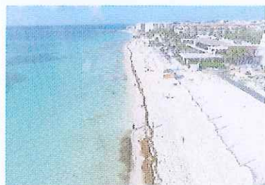
Figura 18. Vista norte, Playa Mamitas.