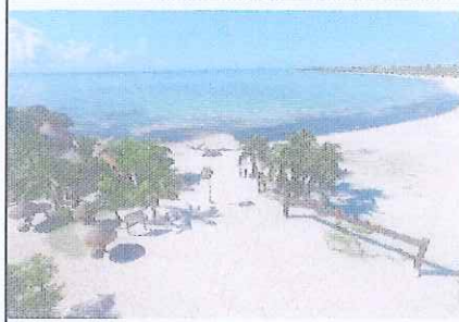
Figura 4. Punta Esmeralda.