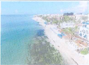
Figura 14. Vista Calle 8 a Calle 4.