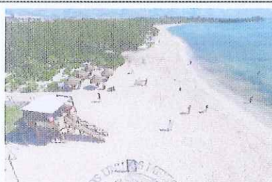
Figura 11. Playa 88, limite sur.