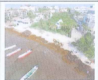
Figura 3. El recodo