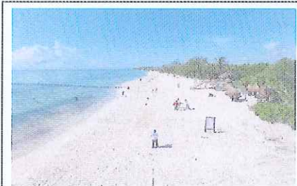
Figura 10. Playa 88, limite norte.