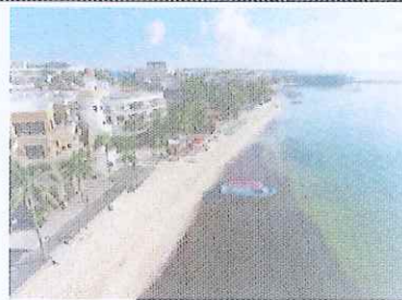
Figura 15. Vista Calle 8 a Calle 12.