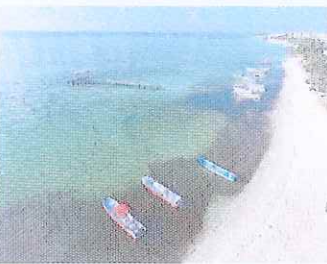
Figura 16. Playa el Recodo (muelle y embarcaciones).