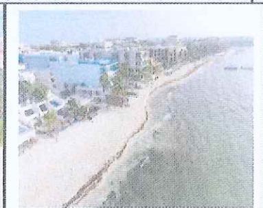
Figura 2. Playa Caribe