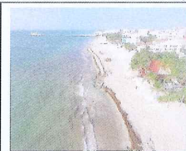
Figura 1. Playa Caribe