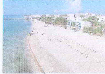
Figura 13. Vista Calle 4 a Playa Caribe.