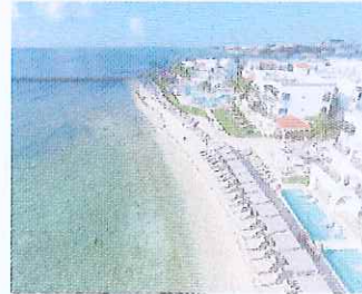
Figura 17. Playa del Hotel Hilton y Av. Constituyentes.