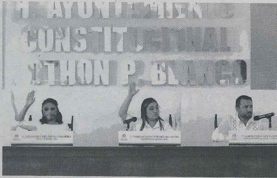
PROYECTO. El cuerpo colegiado aprobó el dictamen para la municipalización del fraccionamiento "Andara Club Residencial".