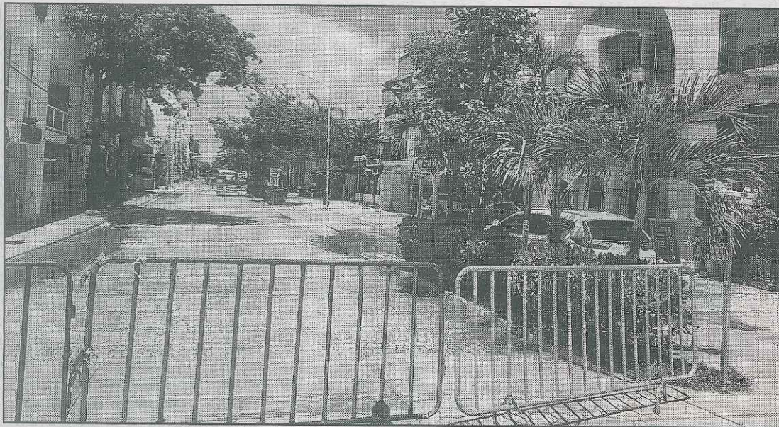
Debido a la peatonalización de la Décima avenida, conductores tienen que circular en sentido contrario pudiendo provocar algún accidente.

Habitantes de la zona señalan que las autoridades debieron dar aviso con antelación porque la medida ha generado conflictos entre conductores, ciclistas y peatones