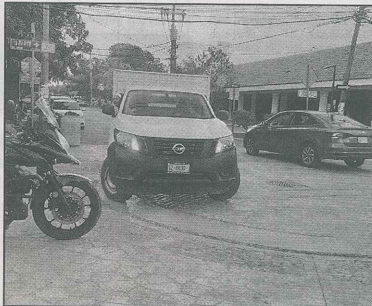
Piden capacitar a elementos de Tránsito para brindar mayor información a los automovilistas y ciclistas.