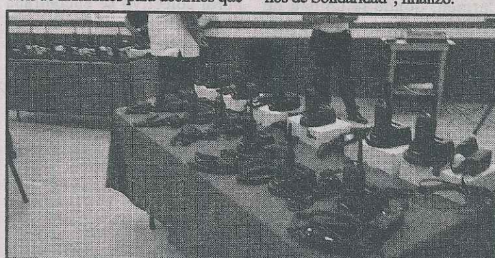
Se realizarán cambios contundentes dentro de la corporación policiaca, manifestó el secretario estatal de Seguridad Pública, Jesús Alberto Capella Ibarra. Necesarios luego del incremento en índices delictivos de hasta 200 %, lo peor de la entidad en este momento. El Estado entregó 50 radios tipo TPH 900, lo más avanzado en tecnología.