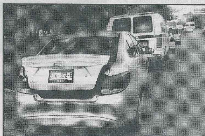
La unidad más afectada fue un Aveo, el cual tras ser impactado fue proyectado contra un tercer automóvil.