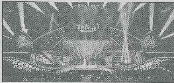
Uno de los premios más esperados de la noche será para Raphael, quien recibirá el Premio de Honor por toda una carrera musical.

El comité organizador refirió que son evaluadas todas las películas por un jurado integrado por 121 profesionales del sector audiovisual y una comunidad de más de mil cineastas, que determinarán a los ganadores de los Premios Platino. Han confirmado su asistencia entre otros el actor argentino Chino Darín, la actriz y cantante argentina Lali, los españoles Paz Vega, Óscar Jaenada y Maxi Iglesias, la actriz colombiana Angie Cepeda, la actriz y cantante chilena Daniela Vega, la actriz argentina Juana Viale y el actor y productor colombiano Manolo Cardona.